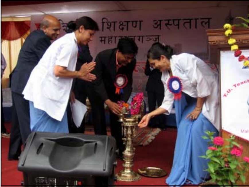
शिक्षामन्त्री प्रदीप नेपाल त्रि.वि शिक्षण अस्पतालको वार्षिकोत्सव समारोह उद्घाटन गर्नुहुँदै ।

समारोहलाई सम्बोधन गर्दै त्रिविका सहकुलपतिसमेत रहनुभएका मन्त्री नेपालले यस अस्पताललाई प्राप्त जनविश्वास नै यसको सबैभन्दा ठूलो उपलब्धि हो भन्नुभयो ।